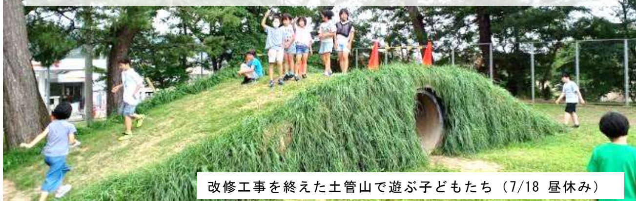
改修工事を終えた土管山で遊ぶ子どもたち（7/18 昼休み）

保護者・地域の皆様、1学期間ありがとうございました。これから長い夏休みです。子どもたちがご家庭や地域で健やかな生活を送れるよう、サポートしていただけるとありがたいです。よろしくお願いいたします。