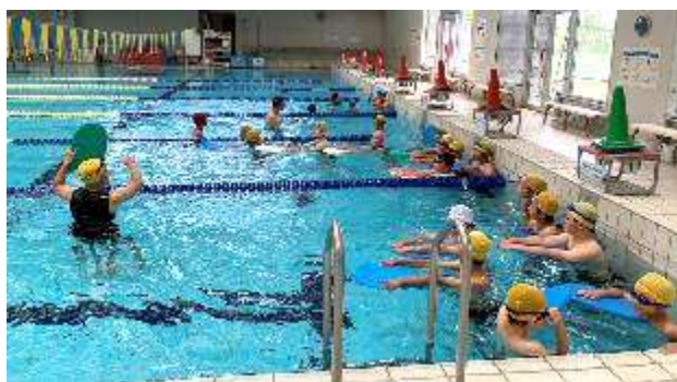
今年度のプール開きとなった5年生の様子

今週から水泳授業を実施しています。各学年4回、週1回ずつ授業があります。今年も、スポーツハウスの快適な環境を提供していただきます。先日の運動会の陸上競技場もそうですが、真野小学校の子どもたちは、他の学校にない環境で運動ができて幸せです。職員一同、安全に水泳授業を行ってまいります。