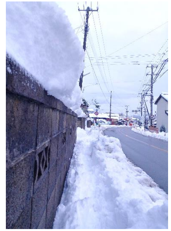
通学路を子ども目線でみると… 落雪にも注意させたいです

雪が降り、大はしゃぎの子どもたち。この日のロング昼休みは、休日のスキー場のような賑わいでした（1ページ目の校長あいさつにあった、松の木の様子もよくわかる写真ですね）。