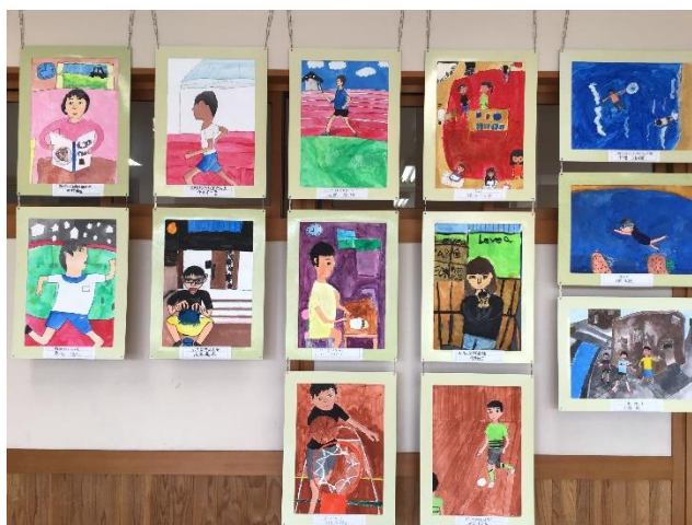
4年生：思い出のあの時