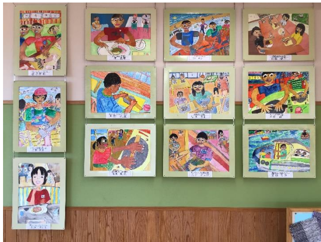
6年生：体験したことの中から