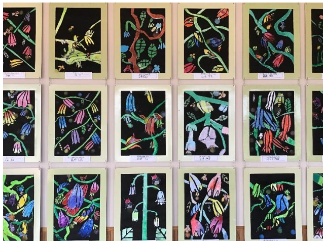
5年生：ステンシル（デザイン／ホテルブクロの花）