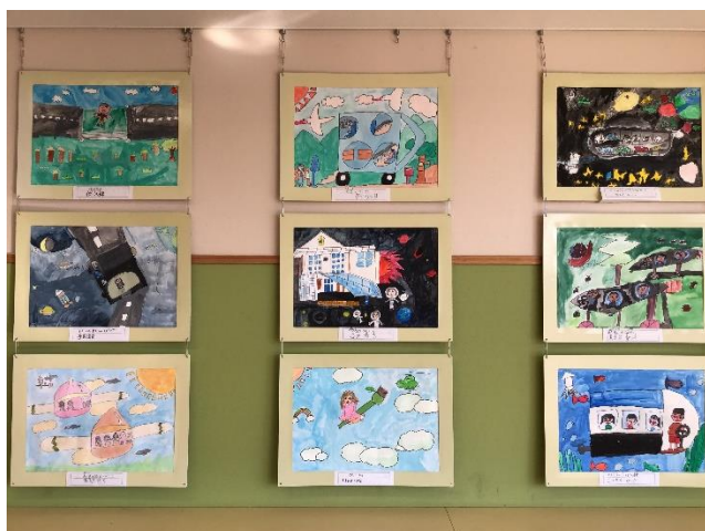
3年生：ふしぎな乗り物