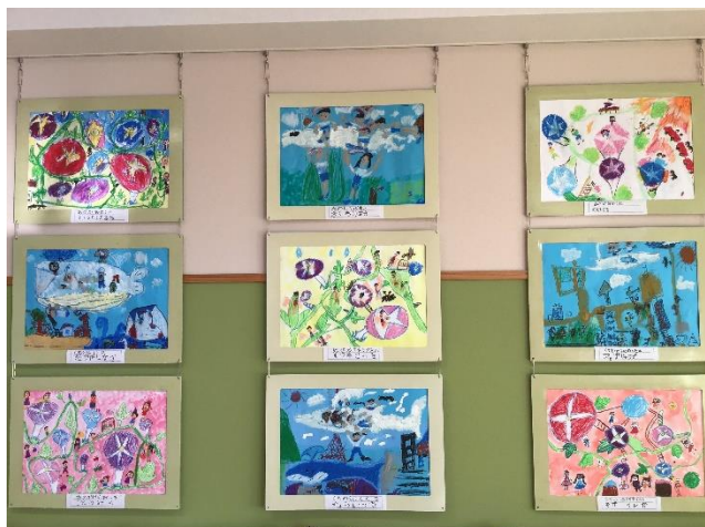
1年生：あさがおの国／くじらぐも