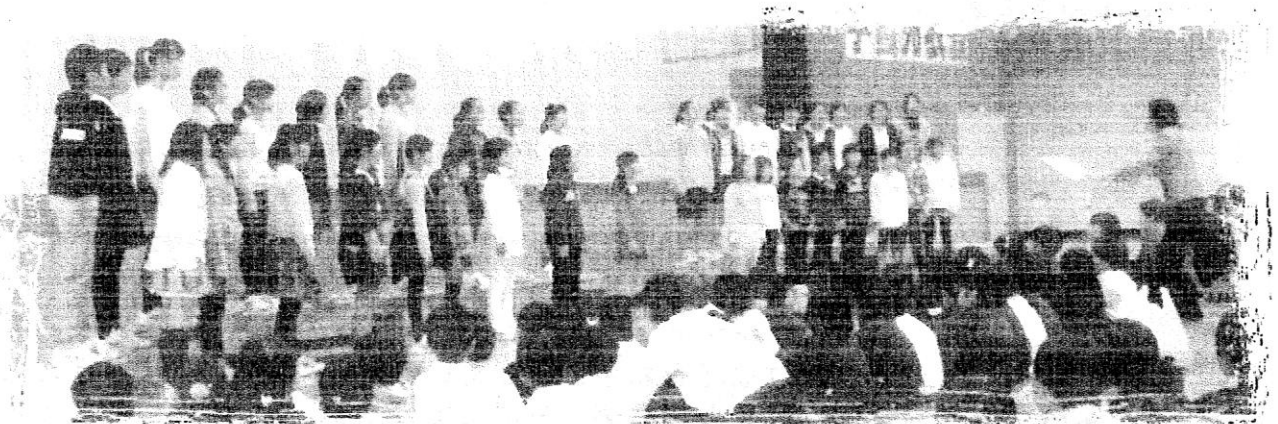
音楽発表会当日は、『写真撮影禁止』だったので、学習発表会の写真です。